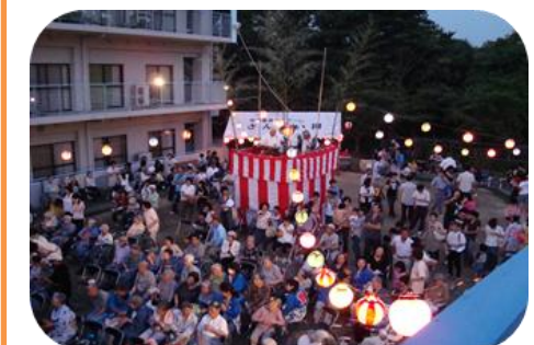
さんすい夏の祭典、納涼大会