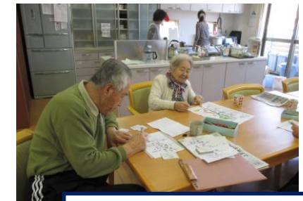
リビングで各々好きな事して過ごされます。