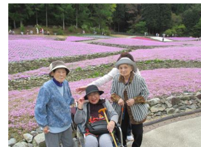
春の永澤寺、芝桜見学

季節に応じて様々なイベントや 外出を考えています。社会福祉法人 三翠会の他の施設も隣接しており、納涼大会や敬老会など、合同での行事も楽しんで頂けます。