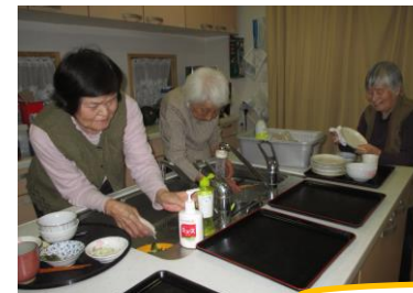
食後の片付けなど、家庭的な生活リハビリを支援します。

なじみの職員が寄り添い、皆様の個性、趣向、能力を考慮し、今の能力を維持できるように生活を支援しています。